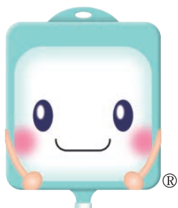
輸液製剤協議会 キャラクターゆえきちゃん

はじめまして、輸液製剤協議会公式キャラクターのゆえきちゃんです。色々と情報を発信するのでフォローよろしくね!